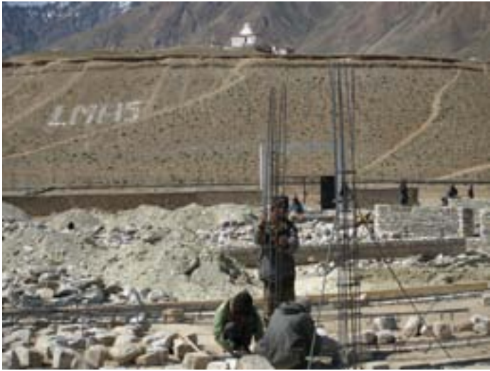
Collocamento delle sbarre di ferro