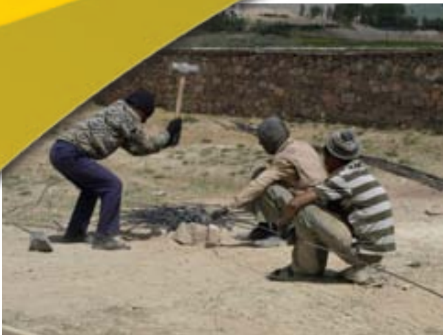
Taglio delle staffe per le barre di ferro