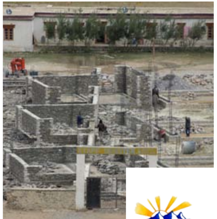
Il cantiere all'inizio di settembre