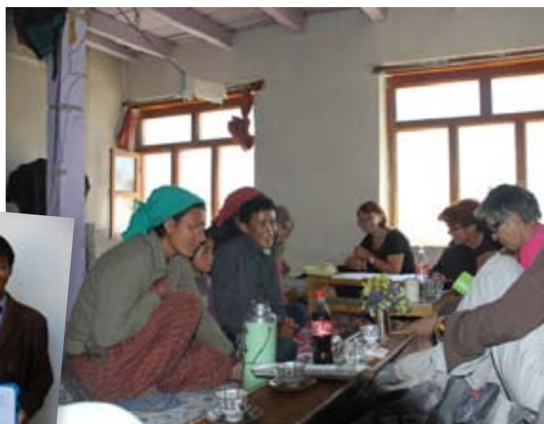
Indagine in una famiglia.