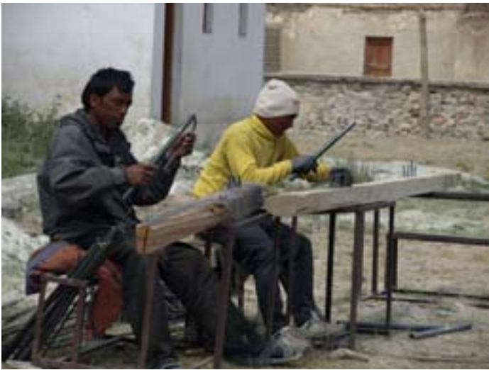
Messa in calibro delle staffe