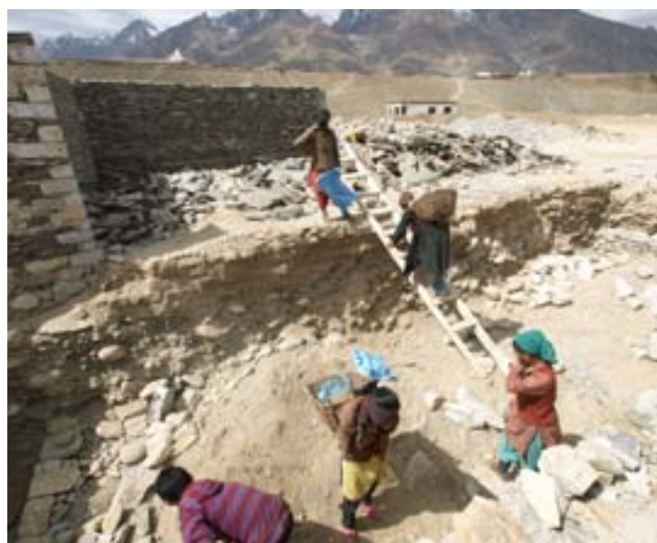
I genitori puliscono le fondamenta dei bagni.