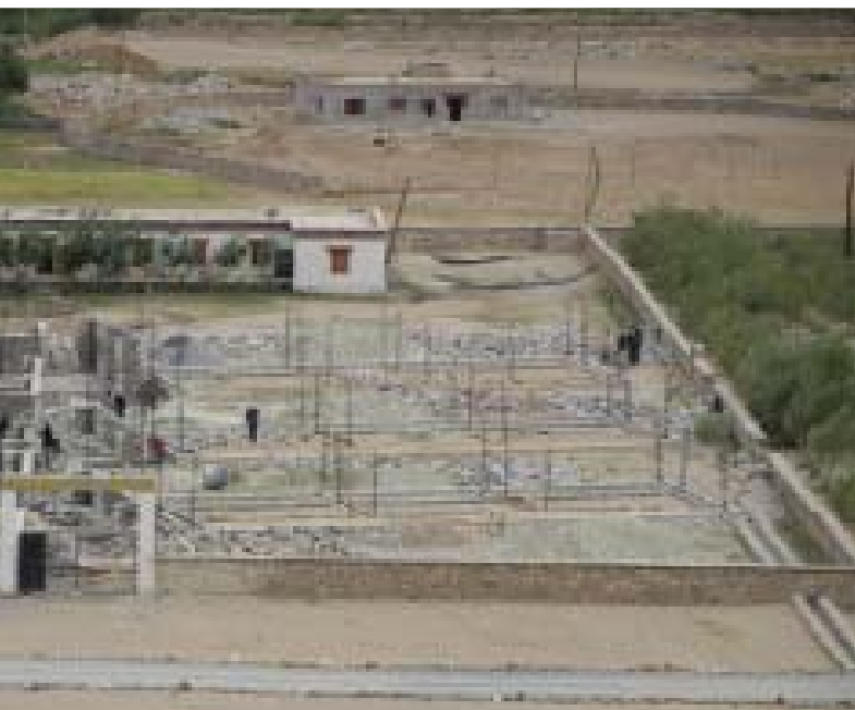
Vista d'insieme del cantiere