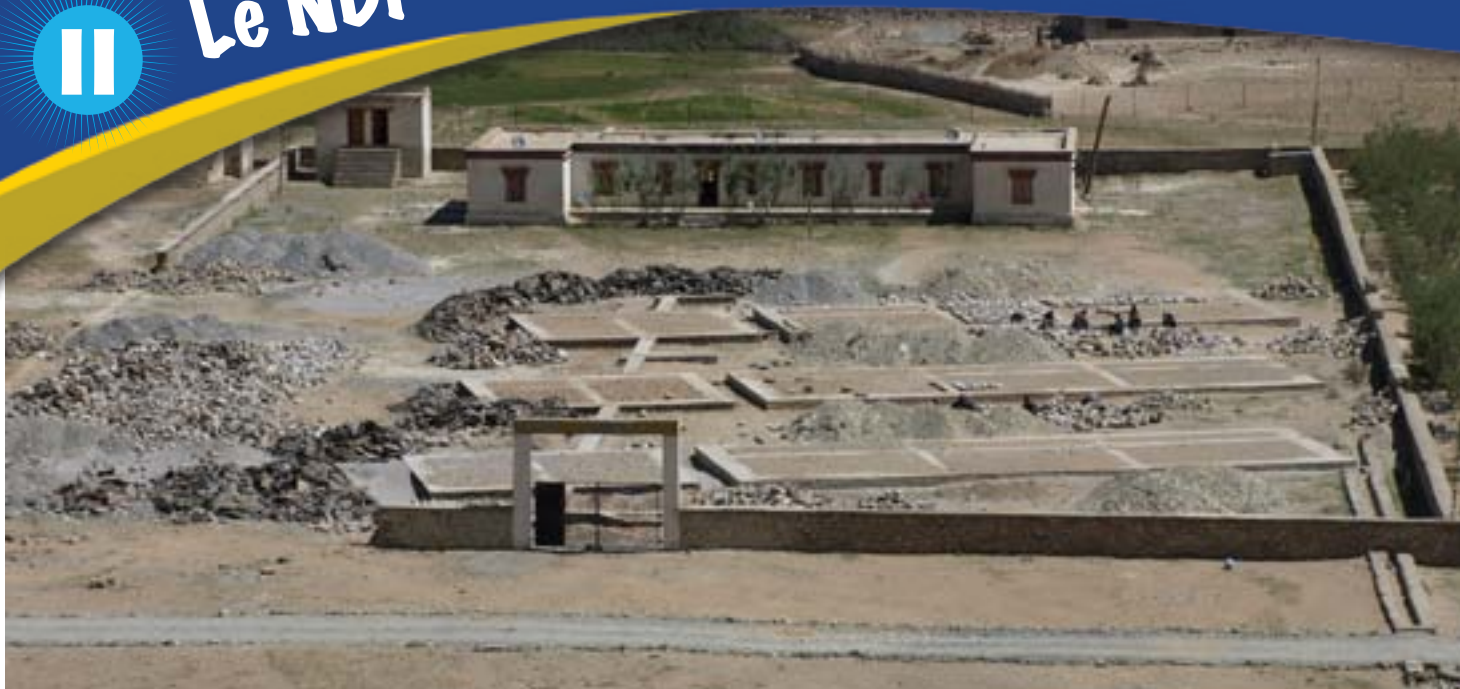
Le chantier début juillet