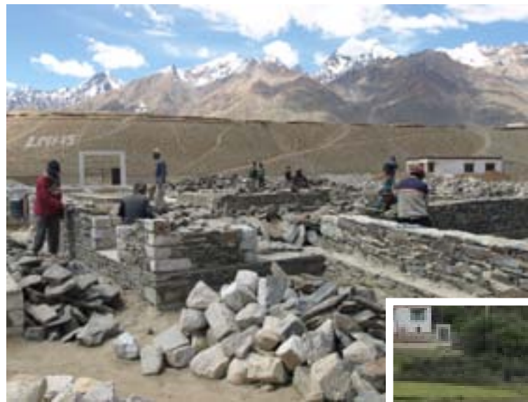
Pietre d'angolo bianche