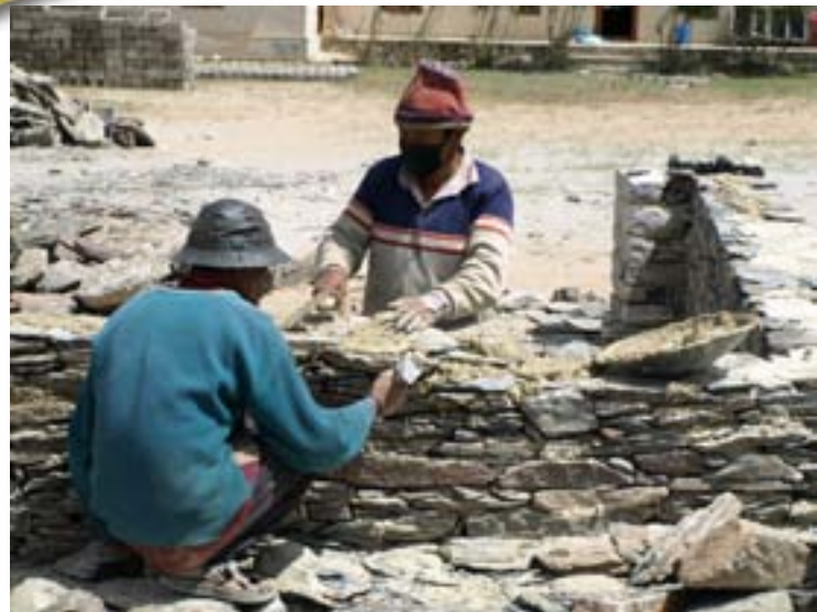
Muratura di pietre nere