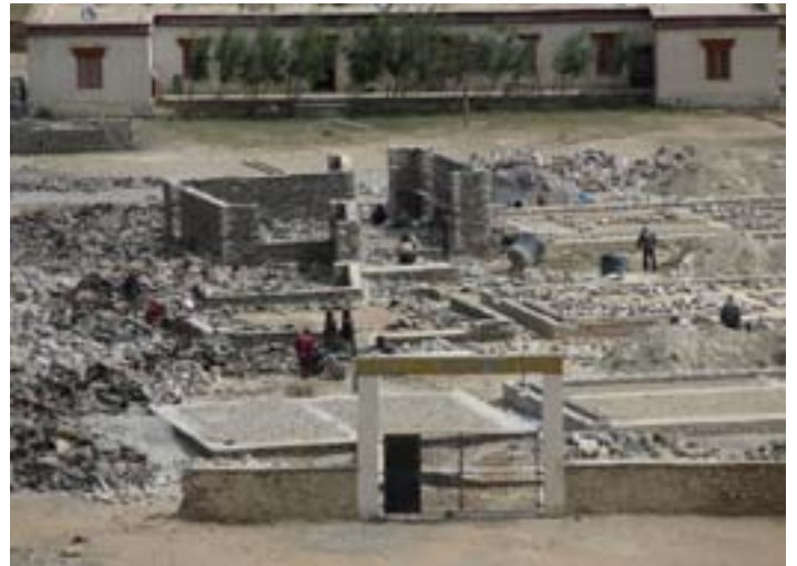
Vista d'insieme del cantiere a fine luglio