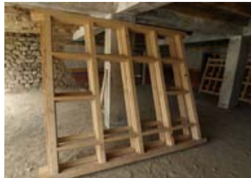
3 finestre della facciata sud che sono state rimandate al falegname in quanto difettose