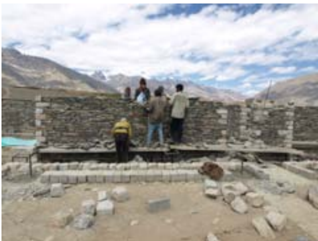
Costruzione di un muro di pietre nere