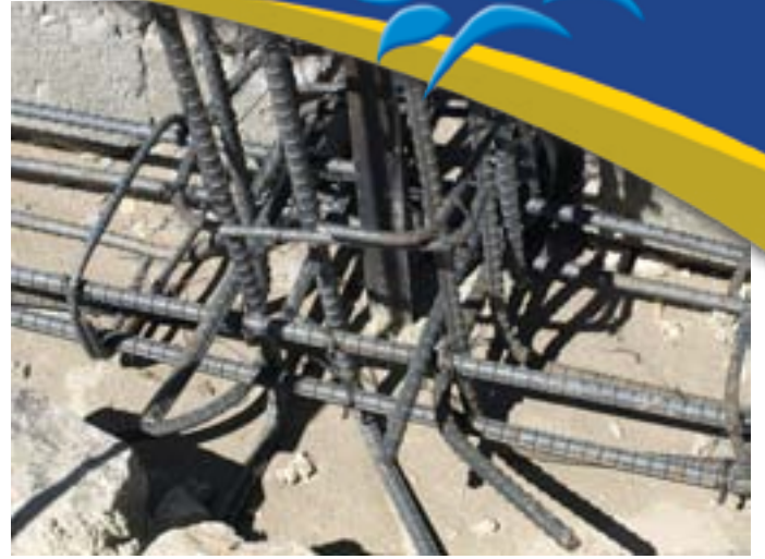
Ancoraggio delle sbarre di ferro orizzontali