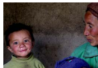
“Mamma e bimbo” dal catalogo della mostra Zanskar-pa di Tina Imbriano