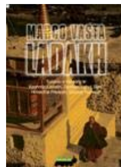
"Ladakh", guida in omaggio agli iscritti al viaggio

Lo Zanskar darà il meglio di sé per accoglierci.